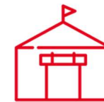
ACCUEIL EN EXTÉRIEUR